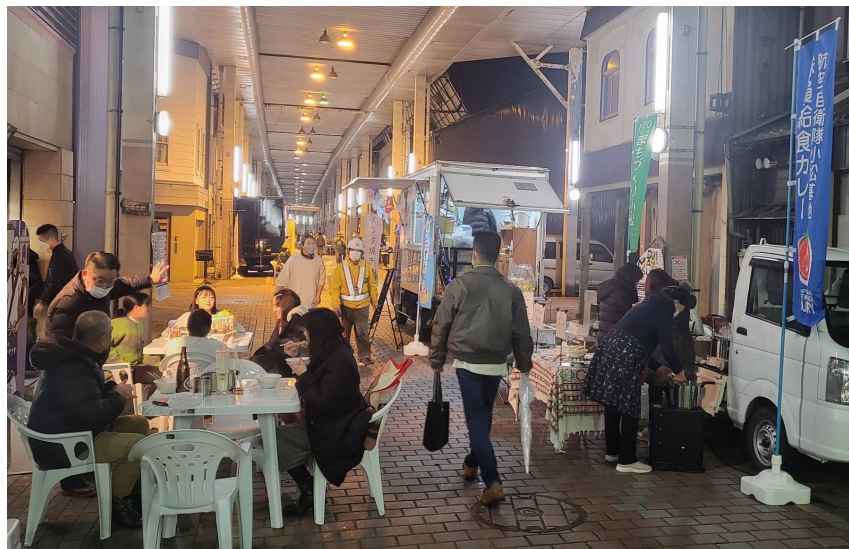
夜市第一弾 (2023年1月) 開催の様子